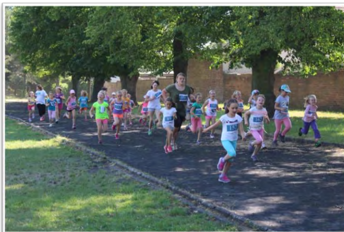
Žákyně 1. stupně na trati 500m.

Na oslavu Mezinárodního olympijského dne se naše škola zúčastnila 21. 6. 2017 olympijského běhu, který se řadí mezi největší běžecké akce v ČR. Závod byl veden v duchu olympijského hesla: „Není důležité vyhrát, ale zúčastnit se“. Do akce se tak zapojila celá škola, ti kteří se necítili k běhu, mohli celou trasu projít. Oficiální start proběhl v 10:15 hod. u školy. Mladší žáci měli vytyčenou vzdálenost 500 m a ti starší se pokusili zdolat úsek 1000 m, obě tratě vedly okolím školy. I přes teplo, kterému museli běžci čelit, žáci statečně bojovali a úspěšně doběhli, popř. došli do cíle. Za svůj výkon a na památku jejich účasti dostali všichni účastníci kartonovou medaili, diplom a müsli tyčinku. Víťezové jednotlivých kategorií získali navíc věcné ceny. Běh provázela báječná atmosféra a jistě i radost z vlastního výkonu, těšíme se na další ročník.